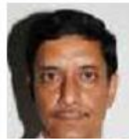
Skuggor bakom huvudet

Fotografering och utskrift med hög upplösning rekommenderas.