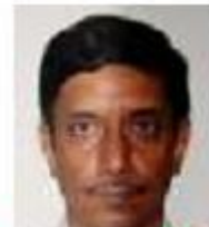
Skuggor i ansiktet